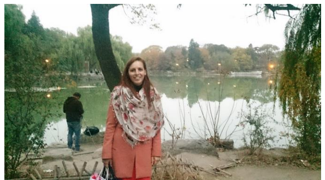
Universitatea Peking, China 2014

Faptele, despre care acest raport vorbește, sunt realizările donatorilor, voluntarilor și ale partenerilor Centrul pentru Inițiere și Dezvoltare Organizațională.